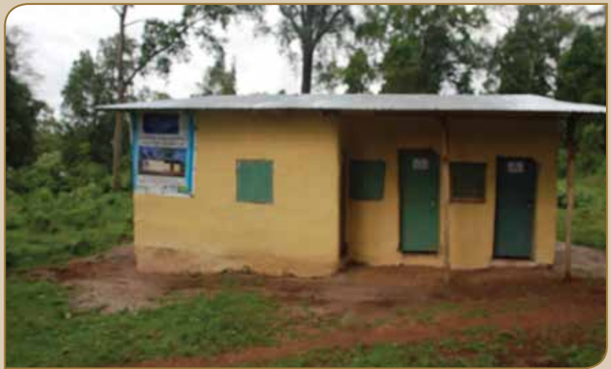
Waajjira CBO ijaarame keessaa isa tokko

Kun hundumtisaa fooyya'iinsa jireenyaa, nyaataa fi misooma magariisaa akkasumas misooma walitti fufaa NRM (Kununsaa qabanya UUmamaa) keessatti mirkaneessuuf gumaacheera ■