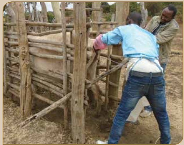
Tajaajila Al yemmuu kennan

1. Sadarkaa gandaafi kutaa gandaatti loon diqaaleessuu duraafi booda maal gochuu akka qaban irratti itti dadammaqiinsa hubannoo hawaasin akka argatu ta'eera.