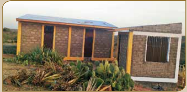
Giddugalaa gabaa beelladaa isa lammaffaa Magaalaa Dellomenaa keessatti argamu