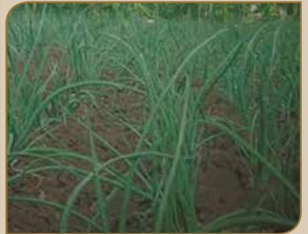
Oomisha kuduraa Ganda Maddaa, Aanaa Madda Walaabuu keessatti