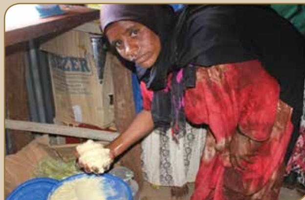
Garee dubartootaa bu'aawwan annanii omishuun gabaaf dhiyessan

P iroojeektiin SHARE BER dubartoota waldaan ijaaruun kan ijaaraman ammoo garee biizinasii xixiqqatti qooduun gargaaree qooda isaan dingdee hawasa waliigalaafi kan maatii keessatti qaban haalaan cimsuuf tumsaa tureera. Dabalataanis, dhiyeessii maallaqaa daldaalaaf barbaachisu dhiyeessuu qofa osoo hintaane qoodaafi dandeettii dubartoonni murtoo kennuu keessatti qaban sadarkaa olaanatti guddisuun danda'ameera. Bifuma kanaan, piroojeektichi dubartoota oomisha annanii irratti ijaaraman miseensota 50 qabaniif deggarsa maallaqaafi teknika taasisaa tureera. Fayadamtoonni misoomaa kun deggarsa karaa adda addaan argachaa turan keessaa caqasuuf, deggarsa leenjii, walitti hidhamiinsa gabaa, beekumsa tooftaa ogansa waldaalee, mala ittiin qulqullina annanii eegan, mala ittiin ragaa qabatanfi haala qabannaa maallaqaa irratti muuxanoo gaggaarii kennee jira. Dabalataani, deggarsa meeshaa annan calalu/dhimbiibu kan akka meeshaa chuner jedhamu, meeshaa cream separator jedhamu, jarkaani annaniif bishaan itti qabachuuf olanifi meeshaalee biro barbaachisoon deggarsaan kennamanii jiru. Garee