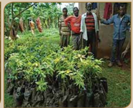
Biqiltuwwan fuduraa maangoofi avokaadoon horsiifaman