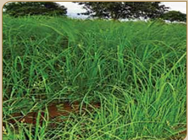
Nyaata loonii fooyya'aa ta'ee maasii qonnaan bulaa keessatti beeksisuu