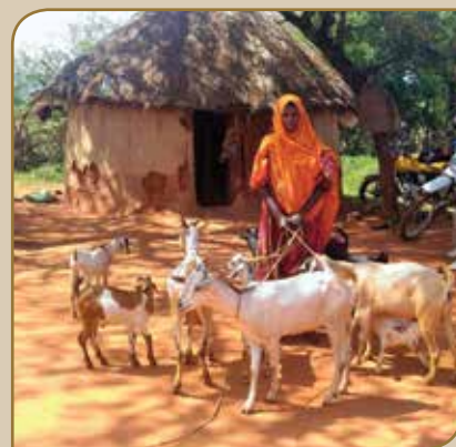
Horsiisa ro'ootaa, Dalloo Manaatti

ummataaf kenna tureera. Haaluma kanaan, bakki itti horsiisan, waan itti lukkuu nyaachisaanfi kunuunsan kenameera. Tokkoo tokkoo miseensaaf ammo lukkuu torba torba kenameeraaf. Akkasumas, aadaa qusannoo garee/waldaa misoomaa cimsuuff kaayyoo piroojeektichaa kan dinagdee hawaasaa fooyyessuu irratti xiyyeeffate sana dhugoomsuuf kan gargaaru waldaaleen liqif qusannaa VSLA jdhaman sadii dhabbatanii jiru. Waldaan kun seera ittiin bulmaataa kan qaban yoo ta'u hangi qusataniifi dheerinni yeroo qusannoo dhaabataa akka qabaatan taasifameera. ■