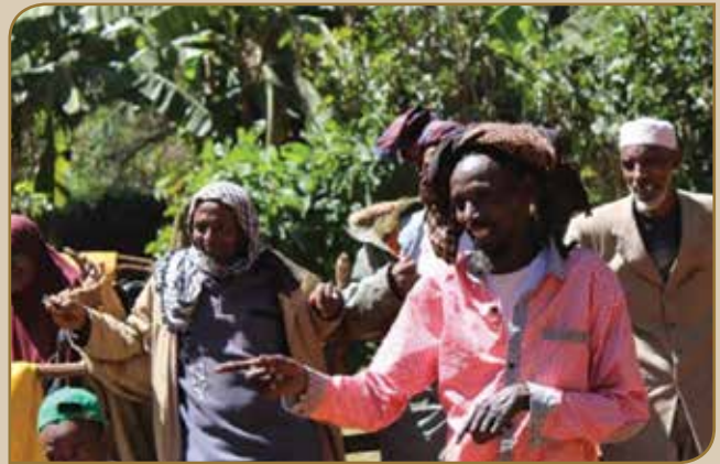
Wayita qaamoleen michuu mariifi daawwii HLPF hawaasa waliin mar'atan