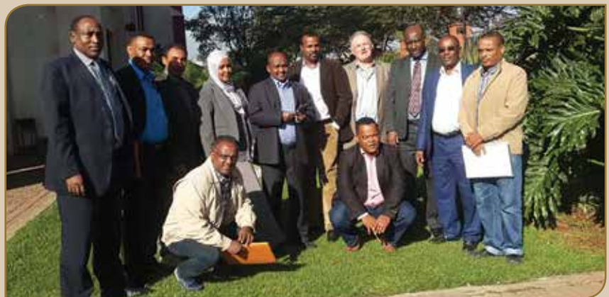
Garee jila leenjii biyya Keniyaatti geggeefame

Y eroon teekinikaa wayita hordoffiin adda ba'e taa'e leenjii, daawwii muuxannoo waljijjiirraafi barnootaa yeroo dheeraa miseensota gama mootummaa jiranii kennamuun hojiirra oolee jira. Haaluma kanaan miseensota gama mootummaatin jiran 182f leenjii hooggansa bishaanii fayyadama lafaa hirmaachisaafi karoora, hordoffii hawaasa bu'uureffate hordoffii gabaasaa hojiirra olmaa GIS/GPS, garee koorniyaafi karoora maatii. Dabalataanis muuxannoo wal-jijjiirraa keeniyaatti miseensota dhaabbilee 15 OFWE, EWCA,