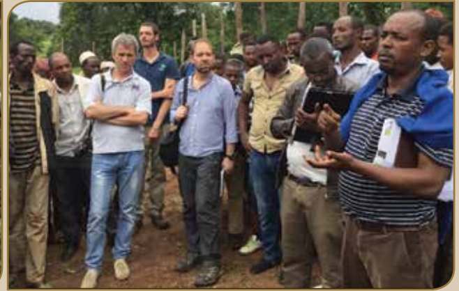
Jila Awurooppaa Ikoo-naannoo Baalee daawwate

M ull'ati daawwannaa jila Awurooppaa baatii Waxabajjii, 2016 keessa geggeeffame adeemsa raawwii hojii piroojetichaa qabatamaatti lafaritti madaaluuf, miira abbummaafi hirmaannaa hawaasa naannowaa sanii maal akka fakkaatu hubachuuf, tooftaalee qindoominaa sadrkaa dhuunfaafi dhabbiilee piroojekticha keessatti mul'atu gamaaggamuufi naannowwaa piroojektoota fooyya'uu qabu jedhamuun yaadi itti laatame madaaluuf ture.