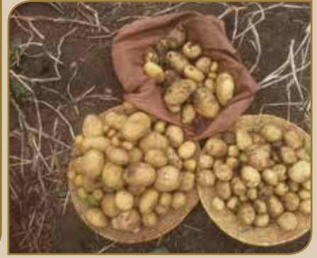
Sanyii ifaatee (dinnichaa) fooyya'aa maasii qonnaan bulaarratti omishame (Ballaxaa bitaa, Guddannee mirga, Duramee gubbaa)