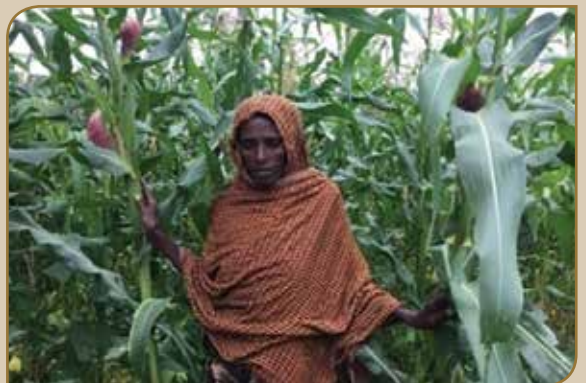
Sanyii fooyya'aa adda addaa kan xaaffii, ifaattee (dinnichaa) fi boqqolloo

Walumaagalatti namoonni daawannaa dirree sana keessatti qooda fudhatanii turan 807 yoo ta'an kana keessaa 115 qonnaan bultoota gandoota adda addaa keessaa wal itti bobba'an yoo ta'u kanneen hafan ammo giddu galootaa qorannoo qonnaafi waajiraalee mootummaa irraa walitti bobba'aniin hojiin madaalliifi daawwannaa dirree gaggeeffamaa ture. Oomisha gosa sanyii filatamoo irraa argame ilaalchisee daataan guuramee kan ture yoo ta'u, qorannoo gageeffameenis oomishi gosa sanyii filatamoo irraa argame kan sanyii gosa naannoo caalee argamee