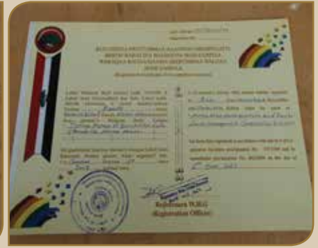
Dookimatii waliigaltee waldaalee gamtaa PRM keessaa akka fakkeenyaatti jiru