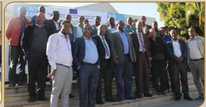
Wayita dhaabbilee michuun sadarkaa ol-aanaa fooramii hirmaatanfi suuraa garee bitaa gara mirgaatti

F oramiin dhaabbilee michuu sadarkaa olaanaatti fi daawwannaan dirree Amajjii 1-5, 2017 geggeeffame. Foramichis hooggansa fi kallattii kaa'uu, adeemsa raawwii gamaagamuu, gar fuulduraatti waan ta'u irratti yaada kennuu fi haala Ikoo-naannoo ol guddisuu irratti kan xiyyeeffateedha. Wayita daawwannaa fayyadamtooti lakkoofsi isaanii danuu ta'e hawaasa irraa maricha isaan waliin geggeeffame irratti hirmaachuu