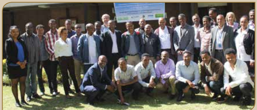
Suura garee hirmaattota workishooppii

mul'ate akkasumas misooma faalama qilleensaa irraa bilisa ta'e mirkaneessuu piroojektichaa agarsiisuuf geggeeffame. Kana qofaas osoo hintaane woorkishooppichi hubannoo waliigalaafi raawwii piroojektichaa daran akka milkaa'uuf afuura garee qu'annaa waliin hojjechuu cimee akka ittifufuu taasisuuf. ■