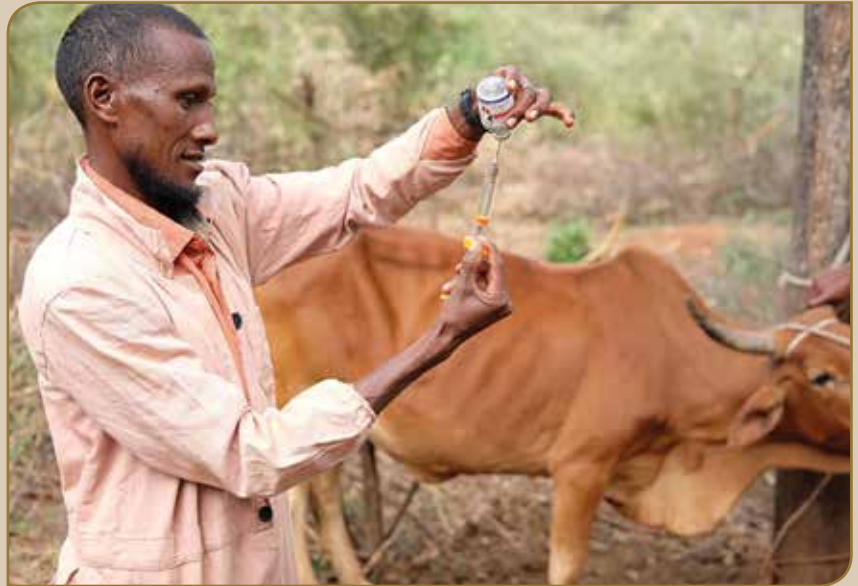
Yemmuu tajaajilli fayyaa looniif kennamu

carraa hojii hoji dhabdootaaf umuun tajaajilichi fufiinsa akka qabaatu taasisa.Inni lammaffaan hawaasa hirkattummaa dhibee beeyiladaa isaaniirra jiru dhabamsiisa. Waaggaa tokko darbe keessatti tajaajilli fayyaa beeyiladaa hawaasaa gandoota 10 keessatti beeyiladoo 118,83( gaalotaa re'ee hoolota, harroota ) ta'anii tajaajila yaalaafi talaallii kennaniiru.Sirni kenniinsa tajaajila kanaa hanga ammaatti qaqqabsiisa qorichaa dabalatee mootummaan deggeramaa jira.Deeggersi kun ammo fufiinsa isaaf human guddaa ta'a. Bu'aan tajaajila fayyaa beeyiladaa hawaasaan kennemuu kun qaama hawaasaa ta'usaafi tajaajila bakkaa bakkatti socho'u ta'uun hawaasa horsiifatee bulaa biraan ga'uuf waliin irratti hojjetamuu isaati. Akka fedhii jiraattota irraa dhiyaatuun tajaajilli fayyaa beeyiladaa manaa manatti deemuu kenneera.