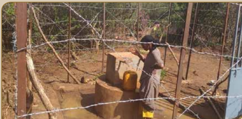
Boolla bishaan dhugaatii mijeessuuf qotame